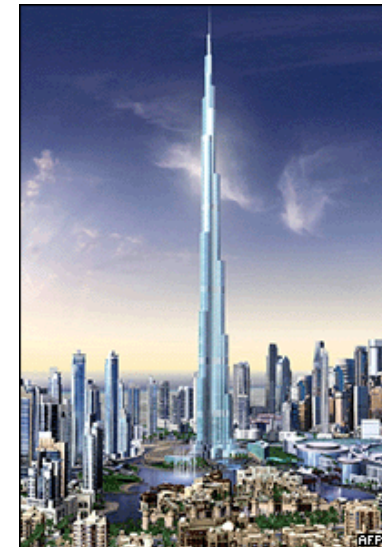
Burj Khalifa (828m)