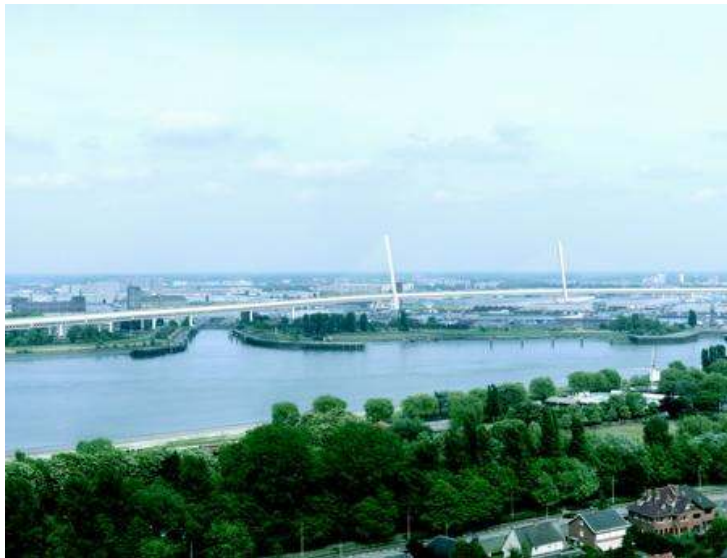
Lange Wapper, Antwerpen

Ontwerpen van nieuwe, efficiënte draagsystemen voor uitdagende structuren