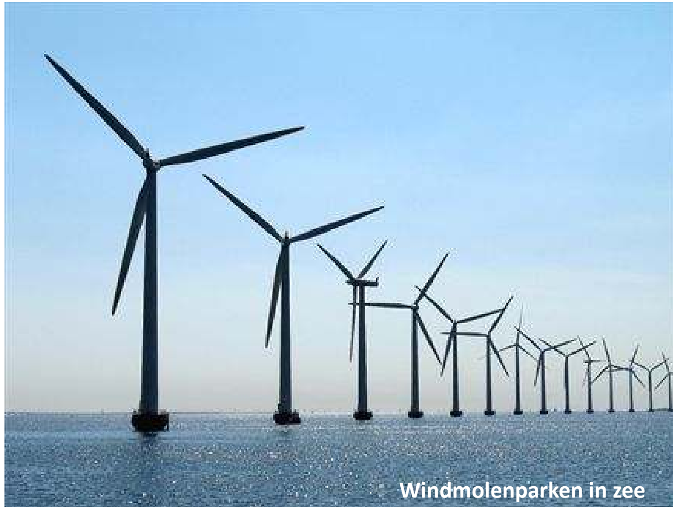
Windmolenparken in zee