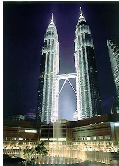
Petronas Twin Towers (452m)